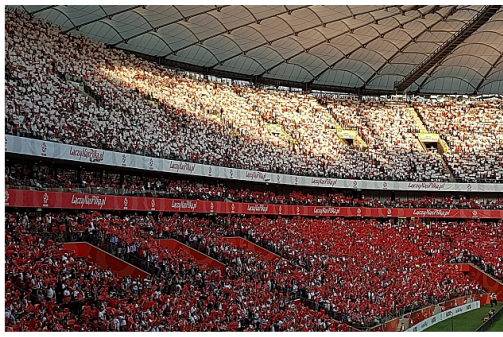
Reprezentacja Polski zawsze może liczyć na gorący doping swoich kibiców