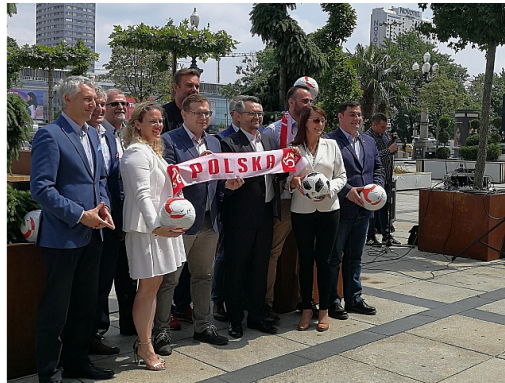
Władze Warszawy zapraszają do stref kibica w siedmiu dzielnicach

- Strefy kibica są zlokalizowane w otwartych przestrzeniach, głównie w parkach i amfiteatrach w poszczególnych dzielnicach. Te miejsca były budowane już w latach obowiązywania przepisów o dostępności architektonicznej - zapewnia Janusz Samel, dyrektor Biura Sportu i Turystyki m.st. Warszawy.