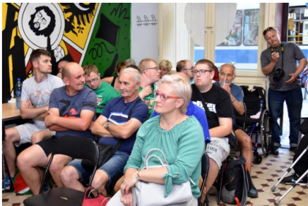
Antoni Piechniczek - legendarny trener reprezentacji Polski, z którą zdobył brązowy medal podczas Mistrzostw Świata w Hiszpanii oraz Władysław Żmuda - trener Śląska Wrocław, zdobywca mistrzostwa Polski w 1977 roku.

W wtorek, 5 czerwca przy ul. Szewskiej w ramach grupy wsparcia dla osób z niepełnosprawnościami i ich najbliższego otoczenia prowadzonej przez Stowarzyszenie Klub Kibiców Niepełnosprawnych, odbyło się niezwykle spotkanie, którego gośćmi byli wybitni trenerzy: